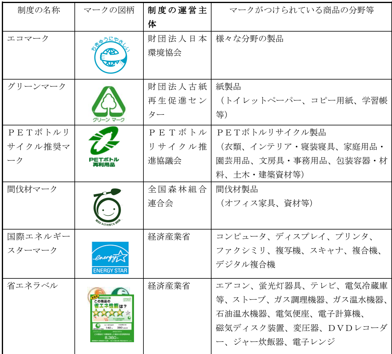
環境物品等の調達の参考となる環境ラベル等一覧表